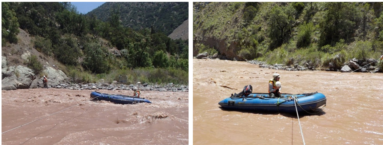
Figura 4: Batimetría del cauce.

El levantamiento del lecho del río se realizó mediante GPS RTK, Spectra Precision modelo EPOCH 50 y modelo R8 (Figura 4). Prácticamente la totalidad del levantamiento se efectuó desde un bote zodiac ya que el río presentó características de escurrimiento turbulento y/o profundo.