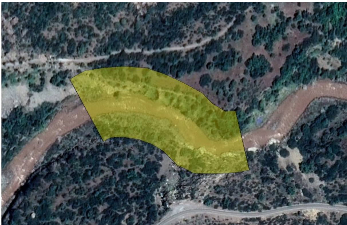
Figura 3. Área de estudio.